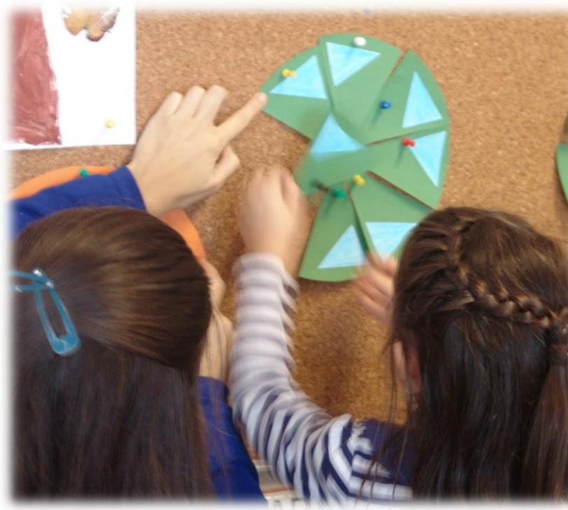
Figuras 5 e 6: Construção de rosáceas (à direita, rosácea com grupo de simetria D_4 )