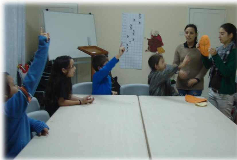
Figuras 5 e 6: Foram colocadas algumas questões para verificação dos conhecimentos adquiridos