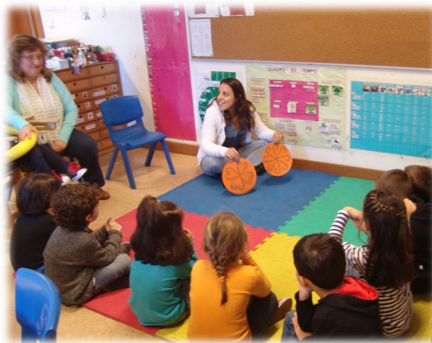
Figuras 1 e 2: Apresentação do conceito de rosácea e diferenciação dos dois tipos possíveis de rosáceas