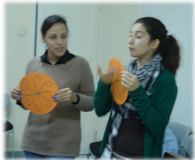
Figuras 3 e 4: Apresentação dos diferentes tipos de Rosáceas