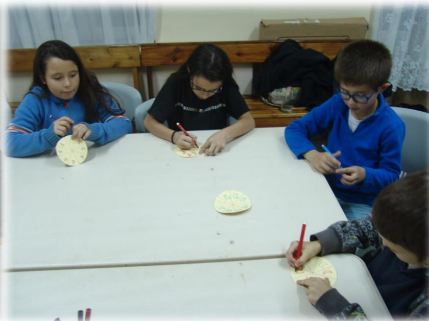
Figuras 7 e 8: As crianças começaram a construir a rosácea que lhes foi proposta