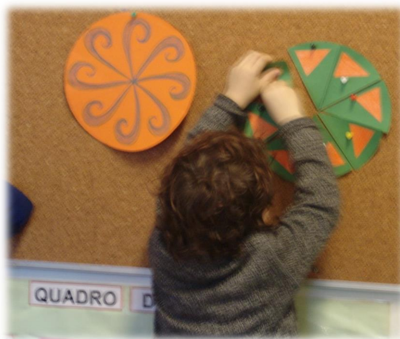
Figuras 3 e 4: Construção de rosáceas (à esquerda, rosácea com grupo de simetria C_8 )