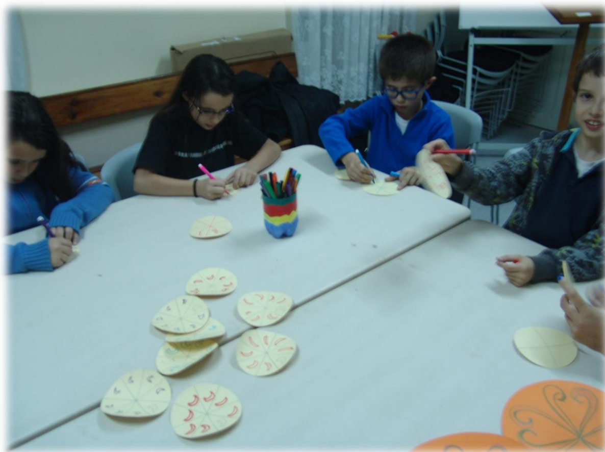
Figura 11: Construção de novas rosáceas, dando asas à criatividade