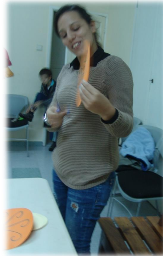
Figuras 1 e 2: Apresentação dos diferentes tipos de Rosáceas