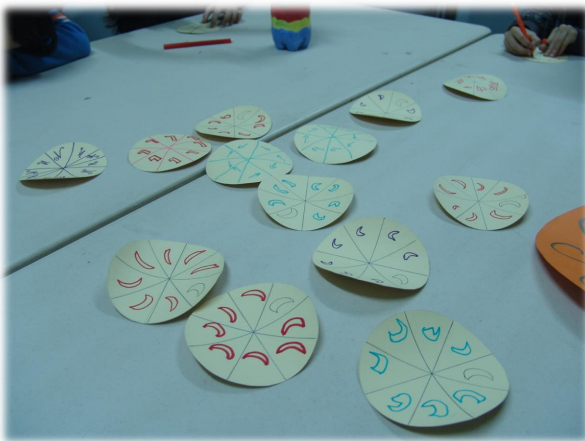
Figura 12: Rosáceas feitas pelas crianças